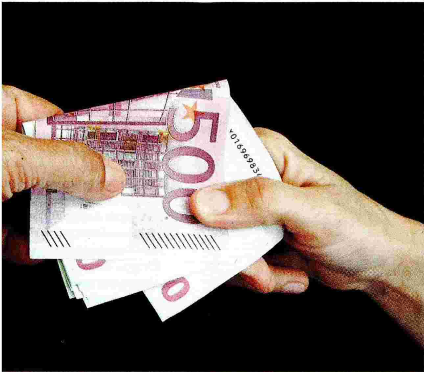
της της δημόσιας δαπάνης, απαιτείται η υποβολή της άδειας λειτουργίας της μονάδας