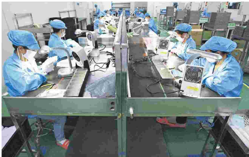
Στόχος του προγράμματος είναι οι καινοτόμες ιδέες να μην περιοριστούν σε επίπεδο σχεδιασμού και έρευνας

Στο πρόγραμμα είχαν ενταχθεί τον περασμένο Ιούνιο 439 επενδυτικά σχέδια με συνολικό προϋπολογισμό 63.135.109,78 ευρώ και δημόσια χρηματοδότηση 37.881.065,87 ευρώ. Εξ αυτών 78 επενδυτικά σχέδια με συνολικό προϋπολογισμό 13.110.599,86 ευρώ και δημόσια χρηματοδότηση 7.866.359,63 ευρώ θα υλοποιηθούν στις Περιφέρειες της Κεντρικής (74 επενδυτικά σχέδια) και Δυτικής Μακεδονίας (4 επεν-