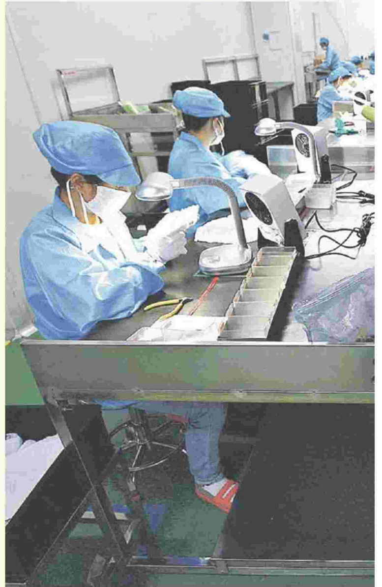
Οι αλλαγές αφορούν το πρόγραμμα για τη μεταποίηση, τον τουρισμό και το εμπόριο-υπηρεσίες

γ) να καταγραφούν και αποτυπωθούν τα απαραίτητα δικαιολογητικά επαλήθευσης τουλάχιστον του 30% του συνολικού επιλέξιμου προϋπολογισμού της επένδυσης, που αποτελεί προϋπόθεση για την ένταξη των δυνητικά ενταγμένων έργων και αποδεσμεύεται με τον τρό-