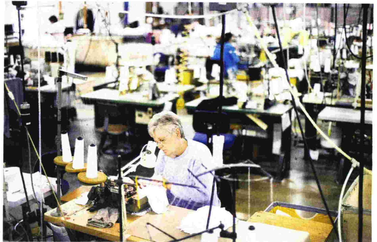
Μετά το κλείσιμο του ΕΟΜΜΕΧ η διαχείριση του προγράμματος «Ενδυσση-Υπόδηση-Νέες προοπτικές» ανατέθηκε στον ΕΦΕΠΑΕ

υφυπουργού Ανάπτυξης και Ανταγωνιστικότητας, Θανάση Σκορδά, δόθηκε νέα παράταση έως τις 26/3/2014 για την ολοκλήρωση των έργων που έχουν ενταχθεί στο πρόγραμμα «Ενδυσση - Υπόδηση - Νέες προοπτικές» (σ.σ. η διαχείριση του προγράμματος μετά το κλείσιμο του ΕΟΜΜΕΧ έχει ανατεθεί στον Ενδιάμεσο Φορέα Διαχείρισης ΕΦΕΠΑΕ). Για την τυπική ισχύ της απόφασης αναμένεται άμεσα η έκδοση του σχετικού ΦΕΚ.