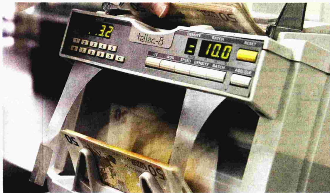
Σύμφωνα με τον Οδηγό του Προγράμματος, είναι δυνατή η χορήγηση προκαταβολής μέχρι το 100% της εγκεκριμένης δημόσιας χρηματοδότησης, μέσω προσκόμισης ισόποσης εγγυητικής επιστολής