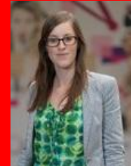
International Project Manager, Design Flanders